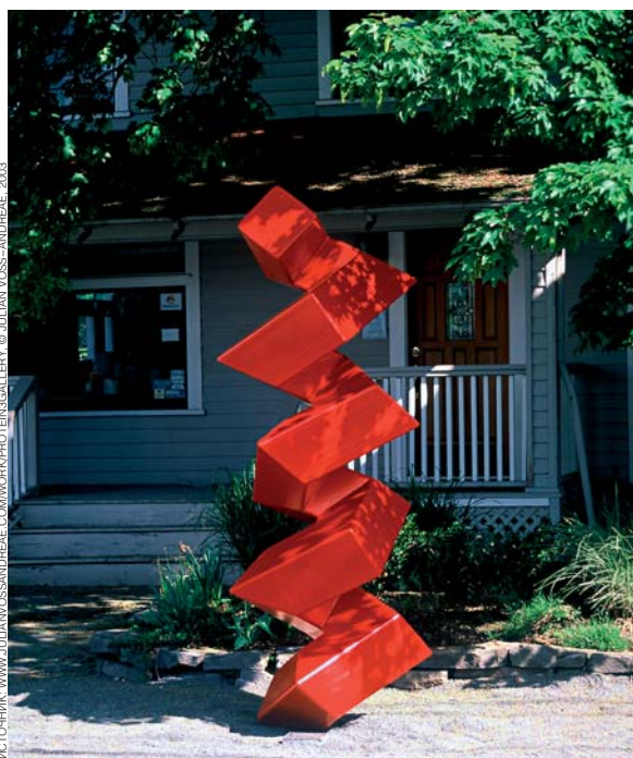
АЛЬФА СПИРАЛЬ СЛУЖИТ МЕМОРИАЛОМ ЛАЙНУСУ ПОЛИНГУ — ОДНОМУ ИЗ ВЕЛИЧАЙШИХ ХИМИКОВ МИРА