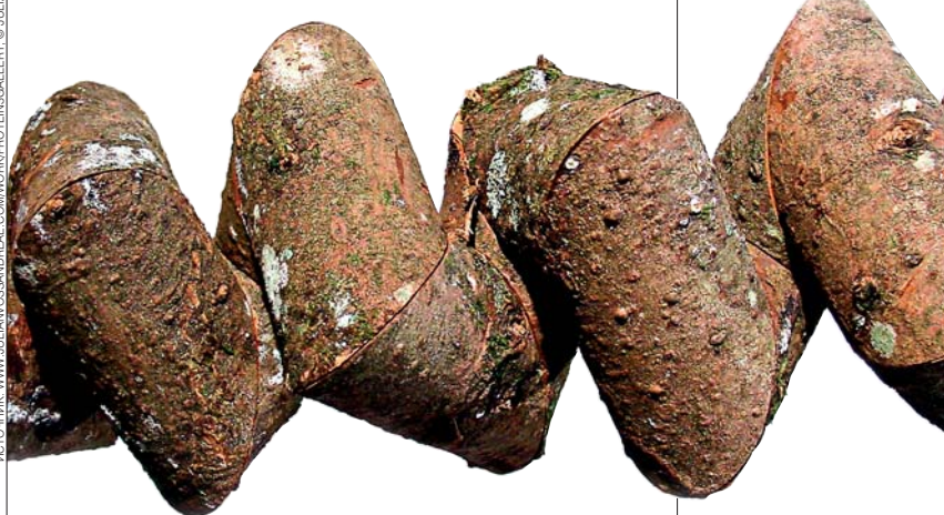
АЛЬФА СПИРАЛЬ — ОДИН ИЗ ОСНОВНЫХ «МОТИВОВ» ПРОСТРАНСТВЕННОЙ УКЛАДКИ БЕЛКОВЫХ МОЛЕКУЛ

но безотходность , считает Восс–Андре, делает его методику близкой к феномену сворачивания белка. Написанная им самим компьютерная программа позволяет рассчитать геометрические параметры разрезов, которые нужно сделать в исходном материале, чтобы после сборки бездушный материал преобразился в уникальное произведение искус-